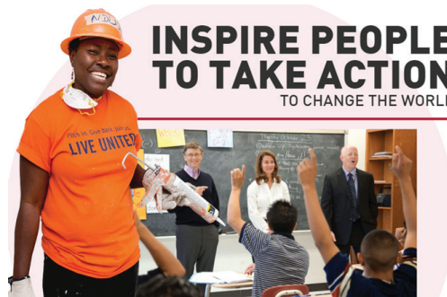
تصویر ۷: بنیاد بیل و ملیندا گیتس

از سال ۲۰۰۶ میلادی تاکنون، این بنیاد ۳۳،۷ میلیارد دلار کمک‌های مالی جهت اجرای برنامه‌های خود در حیطه‌های بهداشت و سلامت جهانی، توسعه جهانی، رشد و فرصت‌های جهانی، آموزش و ارتقاء تحصیلات، و نیز حمایت‌طلبی و سیاست‌گذاری جهانی ارائه نموده است. این بنیاد برای حل مشکلات مهم در پنج حوزه فوق با شرکای خود در سراسر جهان ارتباط دارد.