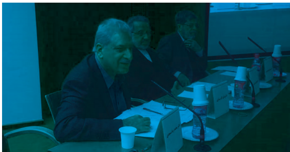
تصویر ۲۵: جلسات بحث و تبادل نظر جهت توجیه سیاستگذاران نظام سلامت

طی مرحله نخست، در جلسات متفاوت، شرکت‌کنندگان ۱۰ سوال ۳ جوابی پیش‌آزمون مربوط به اهمیت مالیات دخانیات را جواب دادند. سپس در جلسات دیگر ضمن آموزش مطالب، بسته آموزشی شامل کتابچه و جزوات مختلف در این باره به آن‌ها داده شد تا مطالعه نمایند. بعد از گذشت ۳ ماه پس‌آزمون اجرا شد. مقایسه نتایج دو آزمون، افزایش سطح دانش سیاست‌گذاران کنترل دخانیات در موضوع اهمیت تأثیر افزایش مالیات بر کنترل مصرف دخانیات را نشان داد که توانست سیاست‌گذاری‌های مربوط به میزان مالیات دخانیات را تغییر دهد.