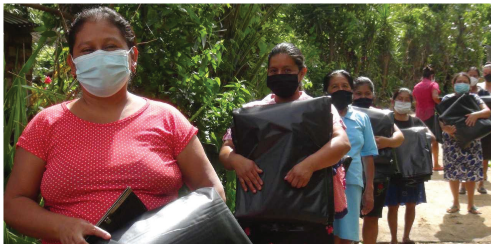
تصویر ۹: دریافت بسته‌های حمایتی پس از طوفان شدید آماندا، ۲۰۲۰