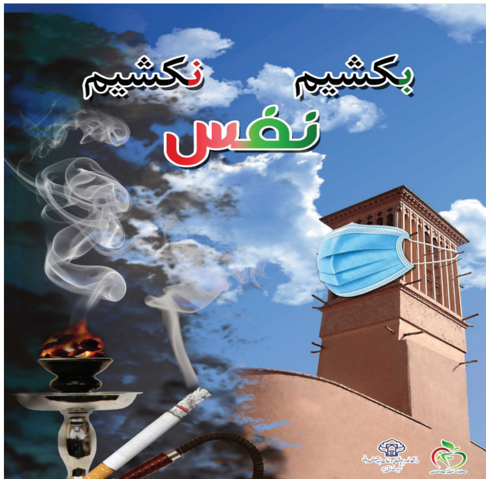
تصویر ۲۰: لوگوی طرح «نفس»