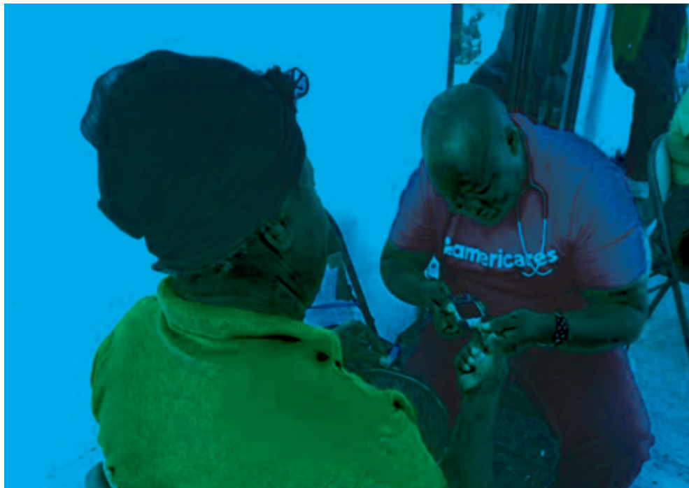
تصویر ۳: خدمت‌رسانی بنیاد امریکرز به نیازمندان