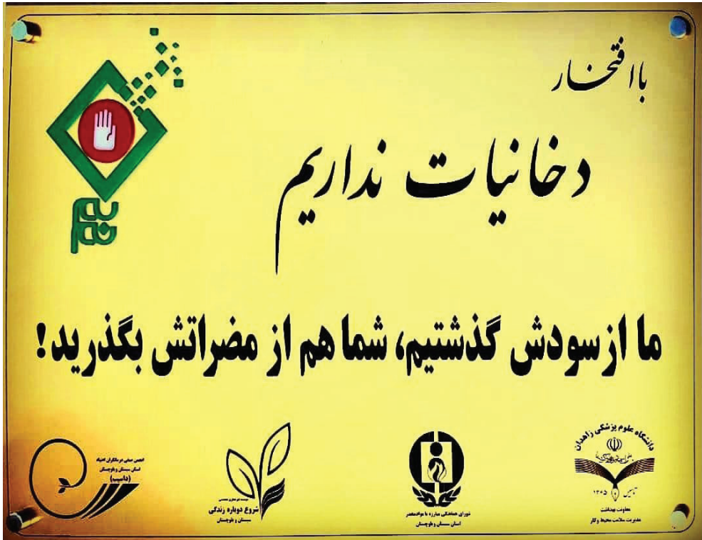
تصویر ۱۶: تابلوی مخصوص پویش نم‌نم برای نصب در اماکن

همچنین، لوح تقدیر چوبی مزین به لوگوی پویش «نم‌نم»، به نام متصدی فروش و نام فروشگاه صادر و توسط چهار نهاد برگزارکننده پویش امضا می‌شود. برای مراسم اهدای لوح، از بسیاری از مسئولین استانی دعوت به عمل می‌آید.