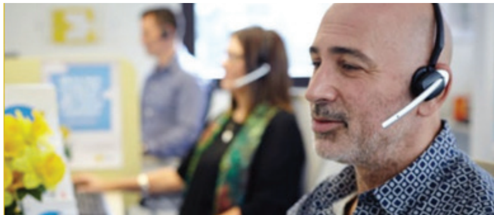
تصویر ۶: ارائه خدمات پشتیبانی به افراد مبتلا به سرطان در انجمن سرطان استرالیا

اطلاعات، مشاوره، حمایت عملی و عاطفی است که برای افراد مبتلا به سرطان متناسب با هر مرحله از بیماری طراحی شده است.