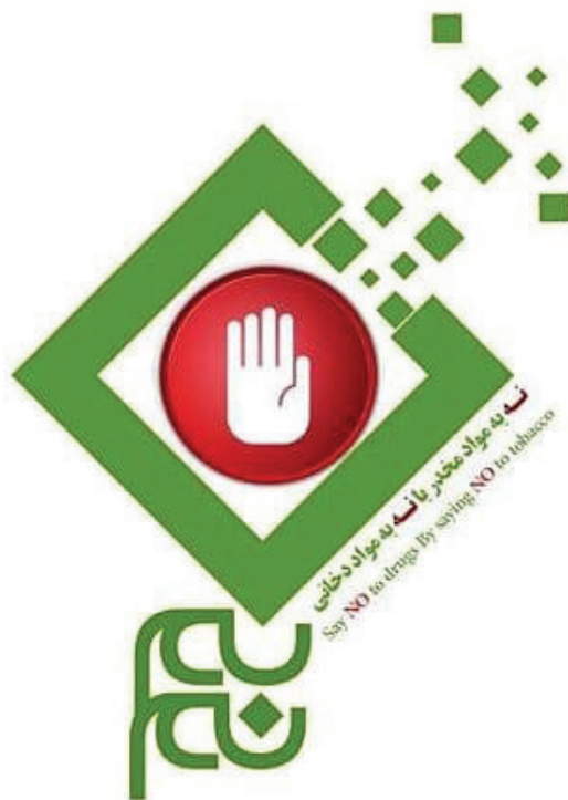
تصویر ۱۵: نماد پویش «نیم»

پویشگران «نیم» باور دارند که استعمال مواد دخانی دروازه ورود به استفاده از مواد مخدر و اعتیاد است. هدف این پویش، شناسایی، تقدیر، معرفی و حمایت از واحدهای صنفی، عرضه‌کنندگان مواد غذایی و خواربار فروشانی است که پس از آگاهی از مضرات استعمال دخانیات طی آموزش‌ها توسط بازرسان بهداشت محیط، داوطلبانه از سود فروش محصولات دخانی چشم‌پوشی کرده‌اند. تمرکز راهبرد پویش، بر «تقدیر و حمایت» از اماکن و فروشگاه‌هایی—به جای «تنبیه، جریمه، پلمپ و یا تهدید» فروشندگان این محصولات— است که با صرف نظر از عرضه محصولات دخانی به فکر سلامتی مردم هستند. در تابلوی مخصوص پویش برای نصب در این اماکن، شعار «با افتخار، دخانیات نداریم. ما که از سودش گذشتیم، شما هم از مضراتش بگذرید!» درج شده است.