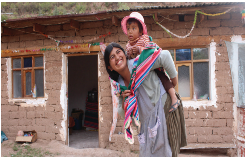
تصویر ۱۱: روستاهای کشور بولیوی، ریشه‌کنی بیماری شاگاس

شاگاس از جمله تغییر مصالح خانه‌سازی دستاوردهای بزرگی را به دست آورد. آن‌ها تنها در طی سال‌های ۲۰۱۷-۲۰۱۵ توانستند به بیش از ۳۰ هزار نفر خدمات ارائه دهند، ۵۰۰ نفر از کارکنان بهداشتی و ۴۰۰ نفر از اعضای جوامع مدنی را آموزش دهند و ۷۵۰۰ نفر را از نظر وجود این بیماری غربال نمایند (۲۶).