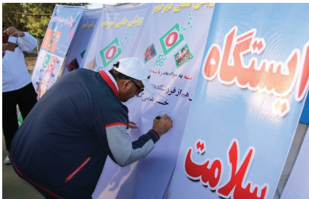
تصویر ۱۹: نمونه‌ای از حضور «نم‌نم» در همایش‌ها

محل همایش‌های پیاده‌روی خانوادگی سال ۱۳۹۸، همایش سالروز جهانی مبارزه با مواد مخدر، نمایشگاه پارک شور و نشاط (با هدف آموزش عموم به ویژه کودکان) و نمایشگاه دانشگاه سیستان و بلوچستان (با هدف آموزش مخاطرات دخانیات به دانشجویان) بوده‌است. در این همایش‌ها، ضمن حضور کارشناسان جهت ارائه مشاوره، توزیع تراکت‌های آموزشی با موضوع نه به مواد مخدر و نه به دخانیات، نصب بنرهای متعدد با موضوع هشدارهای مضرات استعمال دخانیات و ترویج و تشویق عدم مصرف، معرفی فروشگاه‌های پیوسته به پویش نم‌نم و تشویق مردم به خرید از این فروشگاه‌ها، و ترویج سایر اماکن و فروشگاه‌ها به ثبت نام در پویش انجام می‌شوند.