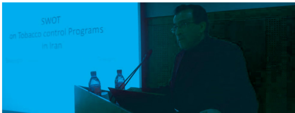
تصویر ۲۴: آگاه‌سازی سیاست‌گذاران حوزه کنترل دخانیات

برنامه‌های کنترل دخانیات در ایران براساس چارچوب ششگانه MPOWER سازمان بهداشت جهانی در پنج مورد شرایط قابل قبولی دارد و تنها نقطه ضعف اساسی آن عدم افزایش مالیات دخانیات می‌باشد. مرکز تحقیقات پیشگیری و کنترل دخانیات با هدف آگاهی و ایجاد حساسیت در ذی‌نفعان این امر، مطالعه‌ای طراحی کرد (۴۴). در این مطالعه مقطعی ۱۱۰ نفر از خبرگان کنترل دخانیات به روش دسترسی آسان انتخاب شدند.