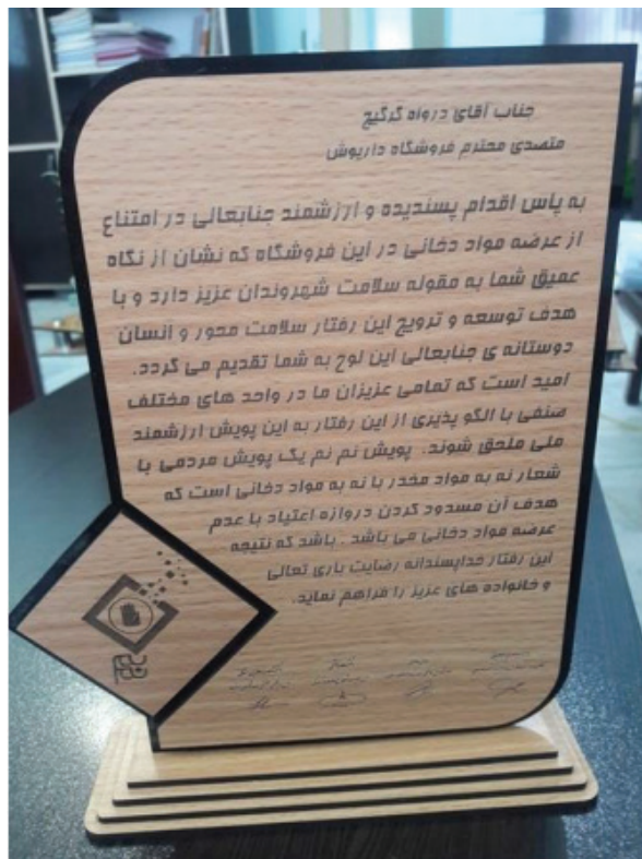
تصویر ۱۷: لوح تقدیر اهداشده به متصدیان فروش در طرح نم‌نم

در مرحله بعد، بخش رسانه‌های اجتماعی پویش با هدف ترویج این اقدام سلامتی، محل فروشگاه را در نقشه مشخص کرده عضویت رسمی آن را در رسانه‌های اجتماعی تسهیل می‌کند تا شناسایی و دسترسی به محل توسط عموم مردم راحت‌تر صورت گیرد. پس از سه ماه از پیوستن به پویش و تداوم شرایط، برچسب مرکز خرید ایمن برای کودکان از نظر عاری بودن از مواد دخانی جهت نصب به فروشگاه ارائه می‌شود. همچنین، آن محل به عنوان واحد خرید ایمن در رسانه‌های اجتماعی معرفی می‌گردد.