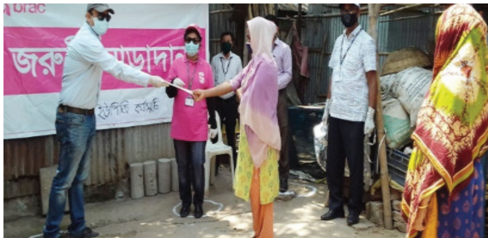
تصویر ۵: فعالیت سازمان برک در راستای افزایش آگاهی زنان