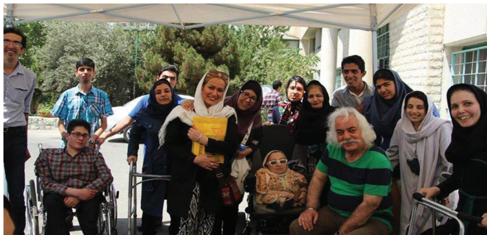
تصویر ۱۴: مجتمع آموزشی، نیکوکاری رعد