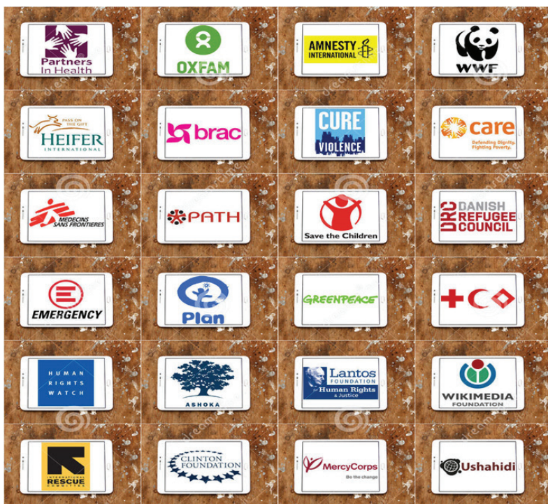
تصویر ۱: لوگوی برخی سازمان‌های غیردولتی بین‌المللی

● سازمان صلح سبز بین‌المللی ۱ ، سه میلیون عضو دارد و نمونه‌ای از شبکه روبه‌رشد سمن‌های بین‌المللی در حوزه زیست‌محیطی است. این سازمان، در بیش از ۴۰ کشور دفتر دارد و بخش هماهنگی‌های بین‌المللی آن در آمستردام مستقر شده است. صلح سبز، هدف از تأسیس خود را «اطمینان یافتن از توانایی زمین در پروراندن تمامی تنوعات زیستی» بیان داشته، بر روی مسائل جهانی همچون گرم‌شدن زمین، جنگل‌زدایی، صید بی‌رویه ماهیان، صید تجاری نهنگ و آلودگی هسته‌ای تمرکز دارد. این سازمان از شیوه‌های برخورد مستقیم، لابی‌کردن و پژوهش برای دستیابی به اهدافش استفاده می‌کند (۱۴).