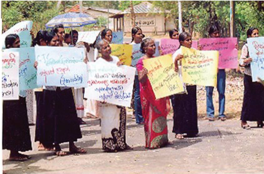
تصویر ۱۰: اعتراض جوامع مدنی بر علیه شرکت انگلیسی امریکایی تولید و فروش تنباکو (بی‌ای تی)

در نهایت فعالان سازمان‌های مختلف درگیر در این اعتراض، در حالی به منزل برگشتند که از یک شرکت بزرگ تنباکو آموخته بودند که باید روحیه خود را ارتقاء دهند و به تلاش‌های خود در آینده ادامه دهند (۲۵).