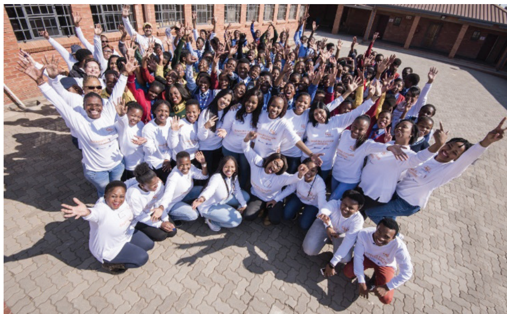
تصویر ۸: بنیاد گیوینگ و ینگز

ام اچ هاب ۲ (مرکز بهداشت قاعدگی) در حال ایجاد یک بستر برخط جدید است که می‌تواند به میلیون‌ها دختر و زن در مدیریت بهتر دوره‌های خود کمک کند. هدف این برنامه ایجاد یک مرکز متمرکز برای شاغلین در رشته‌های مختلف است تا در آن با استفاده از تحقیقات قابل اعتماد و رویکردهای آموزشی مؤثر، بهترین تجربیات مرتبط با سلامت زنان را استخراج کرده، به اشتراک بگذارند (۲۳).