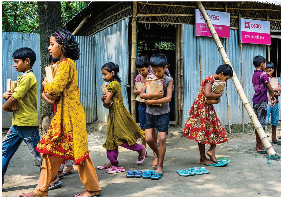
تصویر ۴: فعالیت سازمان برک در حوزه آموزش