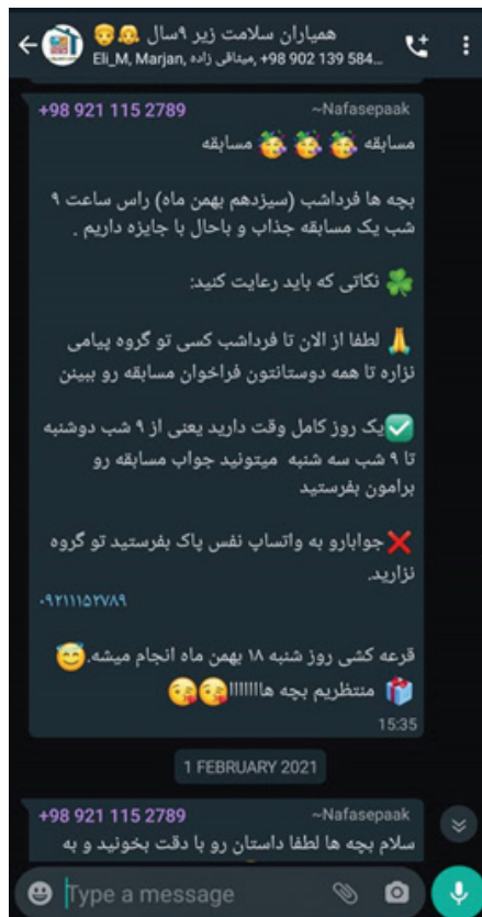
تصویر ۲۳: تشکیل گروه واتساپ برای ارتباط مجزا با همیاران سلامت دختر و پسر