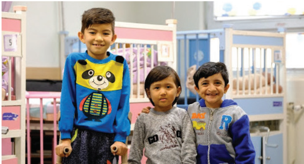
تصویر ۱۳: مؤسسه خیریه بین‌المللی زنجیره امید